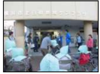
↑ ご利用者を屋外へ誘導