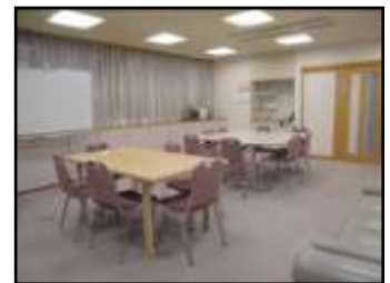
【ボランティアルーム】