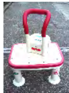
【浴槽手すり・浴槽台】

上白根地域ケアプラザへご意見・ご要望等がございましたら、館内「ご意見箱」へお寄せください。