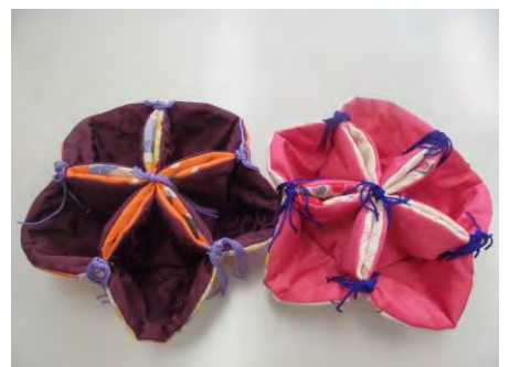
↑ こんな作品ができました