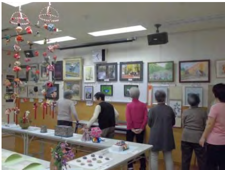
↑ 素晴らしい作品ばかり

11月23日24日に「ふれあい交流展」が開催されました。100点以上の作品が集まり、展示会場はとても華やかになりました。また、当日のイベント（バルーンアート、クリスマスカード作り、和布で小物作り、クリスマスリース作り）には各回満員御礼の参加者により、大変にぎやかな交流展になりました。多くの皆様のご参加、ご来場誠にありがとうございました！