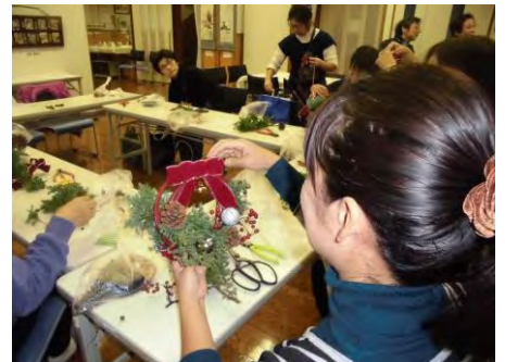
↑ 個性あふれるリースができました