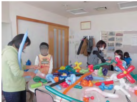
↑ 作ったバルーンでいっぱい