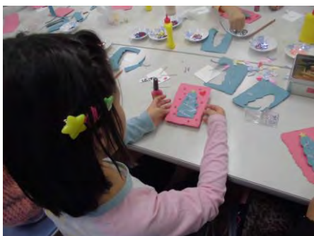
↑ 可愛くデコレーション♪