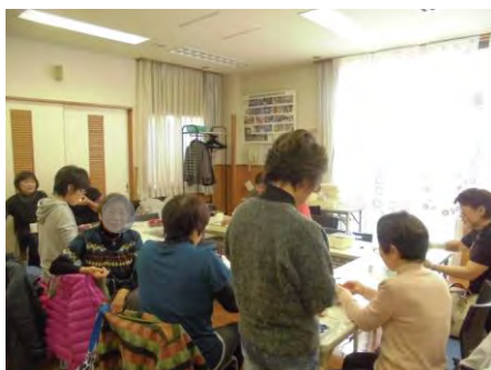
↑ 皆でちくちく縫ってます