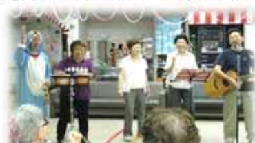
菅井ざん一座の皆さん