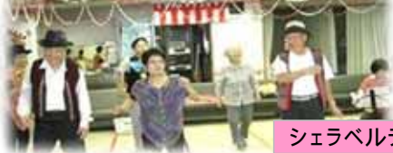
シェラベルテの皆さん