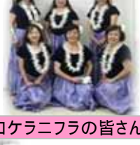
ロケラニフラの皆さん