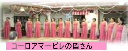
コーロアマービレの皆さん