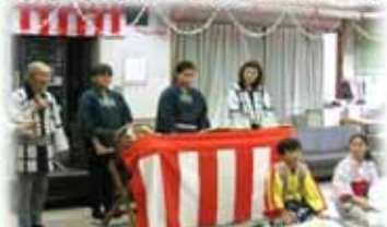
長津田囃子保存会の皆さん

7日間ご参加くださった沢山の素敵なゲストの皆さま、お手伝い下さいましたボランティアの皆さま、準備に携わって下さいました沢山の皆さまに改めてお礼申し上げます。誠にありがとうございました。ご利用者様も一緒に盛り上げ役となり参加して下さいました日もあります、写真にて一部ですがご紹介させていただきます。