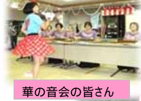
華の音会の皆さん