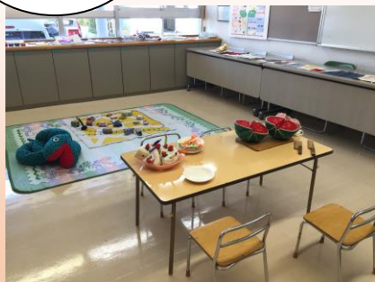
▲ボランティアコーナー

日程:毎月第1水曜日・多目的ホール (「ほっと・るーむ長津田」にて) 第3木曜日・ボランティアコーナー