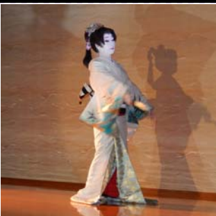
昨年ステージの様子