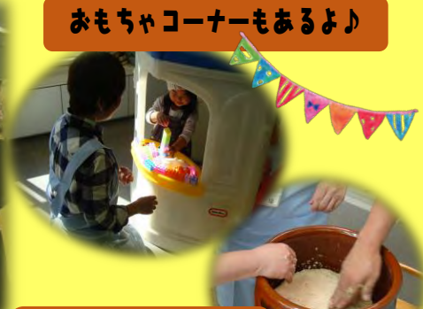
ケアプラザ用に8キロの味噌を作りました♪