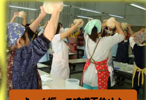
よく振って味噌玉作り♪