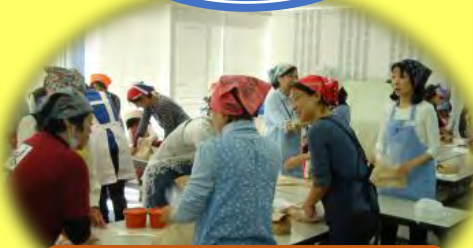
まずは大豆を潰します♪