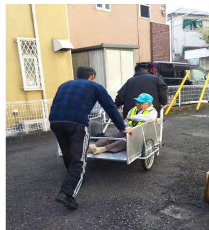
↑ 負傷者搬送中の様子

青木第二地区では東日本大震災を契機に、「防災を通じた世代間交流」をテーマとして“いざという時、助け合えるまちづくり”を目指して活動しています。各町ごとに支援が必要な方、心配な方を把握し、定期的に情報の共有・更新を行い、日常的な見守りに活用しています。さらに、より実践的な場面を想定して平成28年9月11日に「物資運搬訓練」を実施。そして平成29年3月5日に「安否確認訓練」を実施しました。