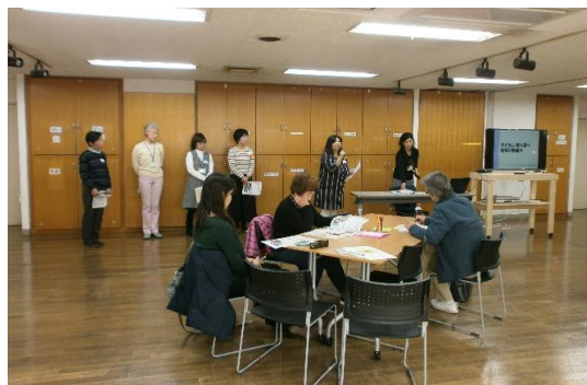
↑ 各地区活動報告の様子

先日、反町地域ケアプラザのエリアのみなさまにお越しいただき、「子どもの居場所づくり講座」を開催しました。講座では、神奈川区担当スクールソーシャルワーカーをお招きし、子どもたちの現状や、子どもたちに地域の大人がなぜ必要なのかをお話しいただきました。