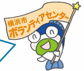
マスコットキャラクター「ボラちゃん」