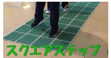
スクエアステップ